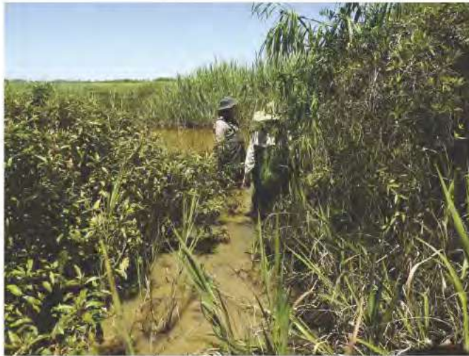
Fig. 7. Áreas inundadas de Yacyretá.

Sin embargo, es necesario destacar la importancia del lago Itaipú y su área de influencia para la herpetofauna paraguaya, ya que constituye el punto más oriental del Bosque Atlántico, y la fauna encontrada en este lugar es única, principalmente referente a reptiles, como es el caso de las serpientes terrestres Clelia plumbea , Oxyrhopus petolarius , Sibynomorphus mikani y Chironius exoletus , las cuales en Paraguay sólo han sido registradas en los alrededores del mencionado humedal.