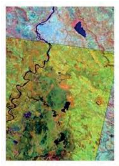
Fig. 1. Cuencas de los lagos Ypacaraí e Ypoá.

Una de las razones de su falta de estudios y desconocimiento probablemente sea su lejanía de la capital de la República, así como la ausencia de ciudades más importantes en términos de densidad poblacional y situación económica, cosa que no sucede con la cuenca del lago Ypacaraí. Otra razón ha sido la falta de accesos hacia el complejo de lagunas, los espejos de agua, embalsados y demás. De hecho se contaba con un solo acceso de difícil ingreso aquel que se realiza por la ruta N° 2, ya que 10 años atrás o menos, el mismo estaba confinado dentro de propiedades privadas, debiéndose contar con el permiso correspondiente para la entrada a uno de los espejos de agua más importante, el lago Ypoá. Las demás lagunas (Cabral y Verá), no cuentan con un acceso directo. Actualmente, si bien la situación ha cambiado un poco más respecto a los accesos, estos siguen siendo insuficientes, lo cual sigue dificultando la toma de muestras y trabajos de campo en general.