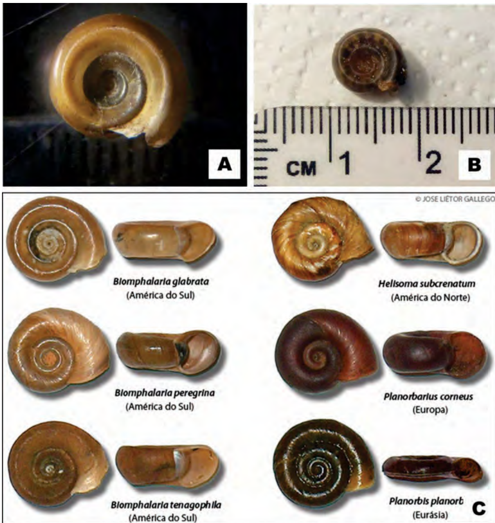
Fig. 2. A. Ejemplares de Biomphalaria tenagophila colectados. C. Tres especies brasileras de Biomphalaria , en comparación con tres planórbidos exóticos comunes en de otros países. (Fig. 2.C. extraída de Planeta invertebrados, (s.f.)).

El otro género de la familia Planorbidae reportado para el Paraguay es Drepanotrema Fischer & Crose 1880, que cuenta con al menos 6 especies mencionadas para nuestro país: D. anatinus , D. cimex , D. depressissimus , D. heloicos , D. kermatoides y D. lucidus (Quintana, 1982). En general, las especies de Drepanotrema tienen un aspecto más grácil y delgado que las Biomphalaria , motivo por el cual es posible diferenciarlas en campo con relativa facilidad.