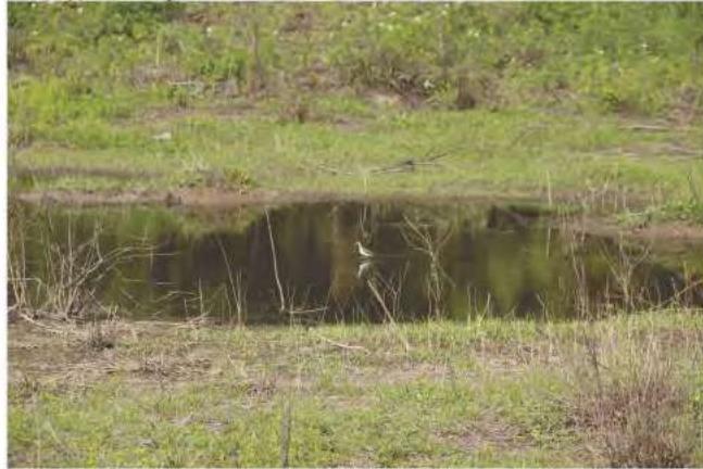
Fig. 9. Pequeña depresión con agua o charco.

En cuanto a los reptiles, fueron registrados Caiman yacare en el agua o zonas costeras, y la culebra arborícola mboi hovy Leptophis ahaetulla (MNHNP 12415), en la vegetación ribereña. Cabe destacar en este ambiente, la presencia del tejú jacaré Dracaena paraguayensis , el cual es un exclusivo habitante del Pantanal, y asociado fuertemente a los meandros del río Negro, con aguas semi-lóticas. También, se registró en este ambiente la presencia de la pequeña lagartija Cercosaura schreibersii , habitando en los islotes flotantes (embalsados), de las plantas estoloníferas.