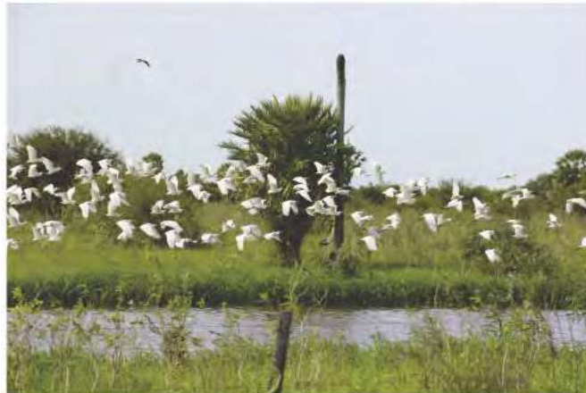
Fig. 10. Paisaje en Alto Paraguay.