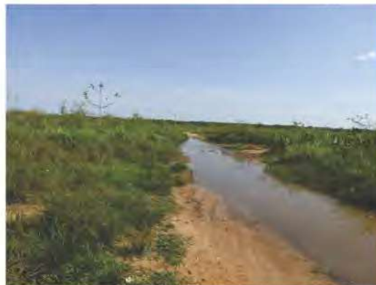
Fig. 6. Hábitat de Biomphalaria tenagophila en el Departamento de San Pedro, en ambiente semi-léntico.