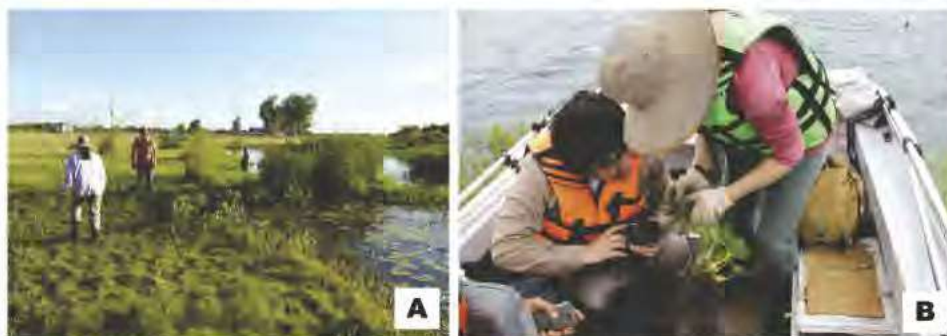
Fig. 4. A. Colectando en Paso de Patria con la indumentaria correspondiente. B. Colectando Biomphalaria tenagophila en las raíces de las plantas acuáticas.

Los ejemplares testigos fueron depositados en el Museo Nacional de Historia Natural del Paraguay, (MNHNPy).