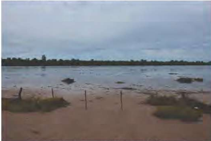
Fig. 11. Laguna salada en el Chaco.

También los reptiles aprovechan estos ambientes, entre los cuales se ha registrado a las tortugas Acanthochelys macrocephala y Kinosternon scorpionoides , el caimán Caiman yacare , y las culebras Mastigodryas bifossatus , Hydrodynastes gigas y Xenodon merremii .