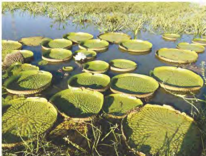
Fig. 8. Población de Victoria cruziana , acompañada de Typha domingensis .

Respecto a los reptiles, se encontraron Caiman yacaré dentro del agua, asociado a aguas costeras y Salvator merianae en áreas de vegetación aledaña a las lagunas meandrosas.