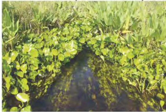
Fig. 5. ambiente semi-léntico de aguas claras, en el departamento de san pedro.

Dada la temporalidad de estos ambientes, no existen reptiles que prescindan de los mismos durante casi todo el año y los utilizan como áreas de alimentación, por la elevada concentración de anfibios que llegan en épocas reproductivas, por lo que es frecuente encontrar serpientes tales como Erythrolamprus jaegeri y E. poecylogirus , las cuales a su vez son muy buenas nadadoras y buceadoras.