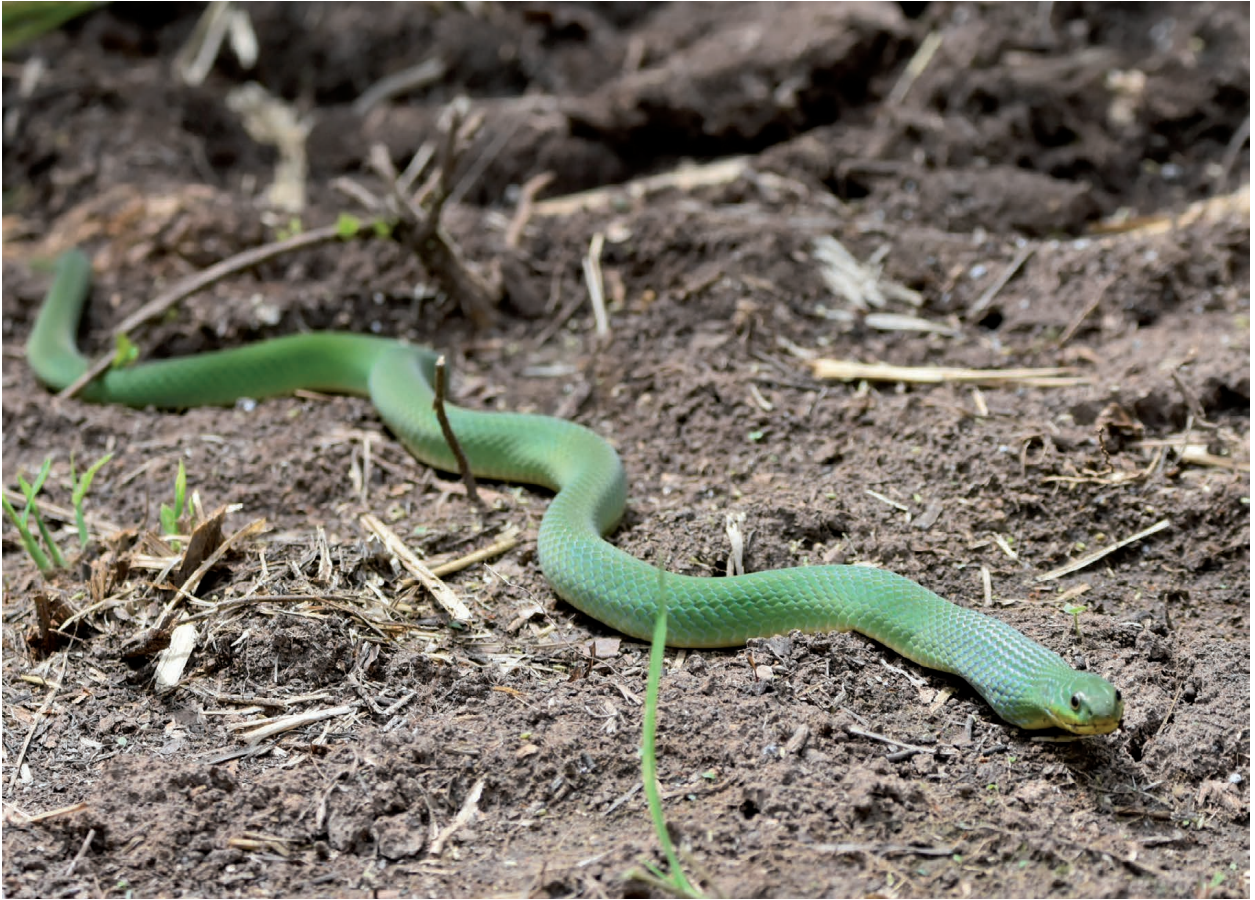
Figura 2. Erythrolamprus albertguentheri registrado en la ciudad Arco del Triunfo, municipio de Cotoca del departamento de Santa Cruz, Bolivia (Fotografía: Efraín Miguel Peñaranda Barrios, 28/04/2023).

Figure 2. Erythrolamprus albertguentheri recorded in the city of Arco del Triunfo, municipality of Cotoca, department of Santa Cruz, Bolivia (Photo: Efraín Miguel Peñaranda Barrios, 28/04/2023).