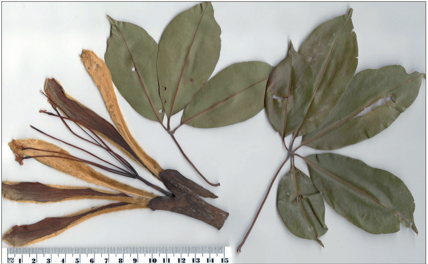
Fig. 1. – Ceiba samauma (Mart.) K. Schum.: flor y hojas.

[De Egea & al. 1203, FCQ]